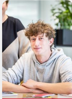
Blok 3: Marketing- communicatie