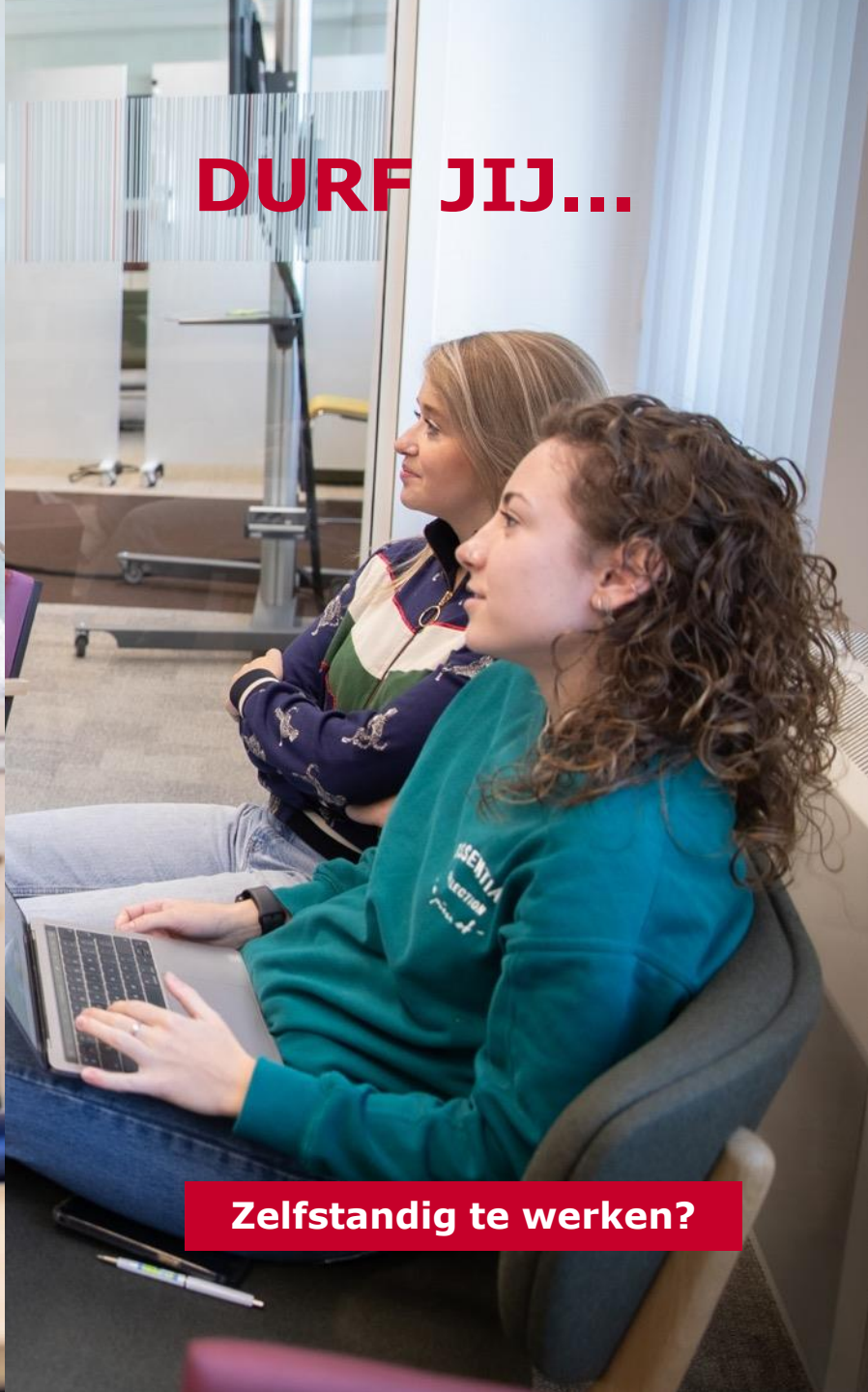
DURF JIJ... Zelfstandig te werken?