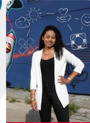
Health & Social Work