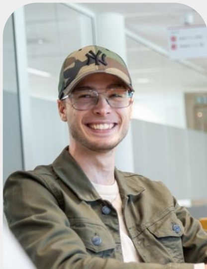
Blok 6: Keuzemodule