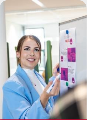
Blok 1 Introductie in Communicatie