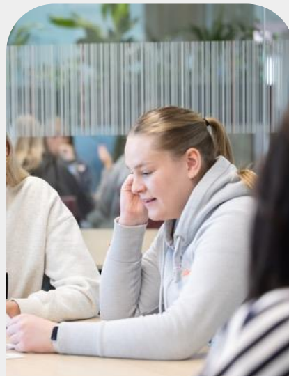
Laatste half jaar: Afstuderen

Met welke keuzes haal jij alles uit je opleiding?