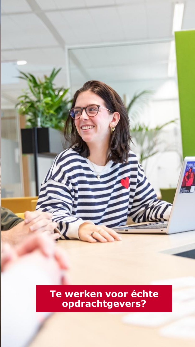
Te werken voor échte opdrachtgevers?