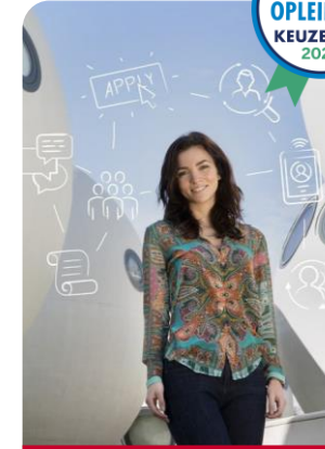
Human Resource Management