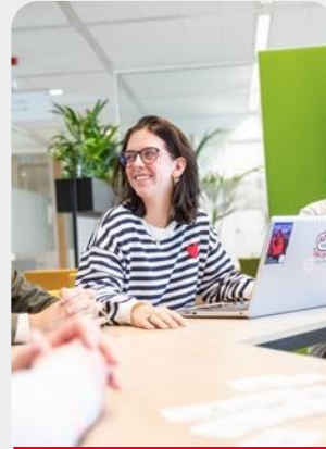
Blok 4: Corporate communicatie