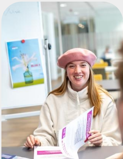
Blok 5: Verdieping