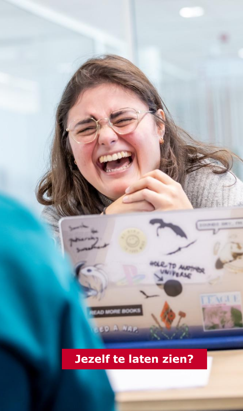
Jezelf te laten zien?