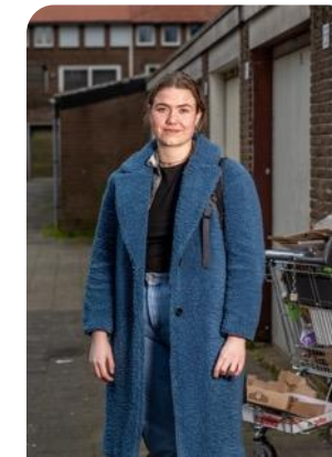
Zorg & Veiligheid