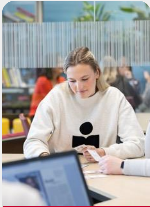
Blok 2: Interne communicatie