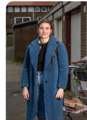
Zorg & Veiligheid