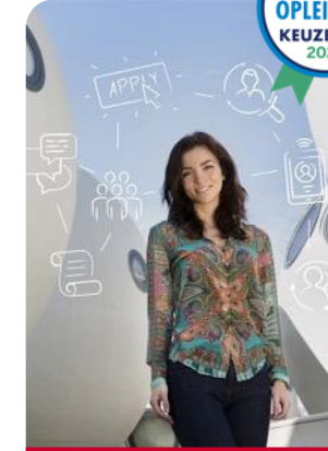
Human Resource Management