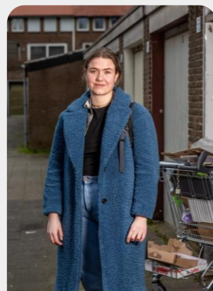
Zorg & Veiligheid