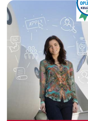
Human Resource Management