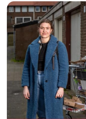
Zorg & Veiligheid