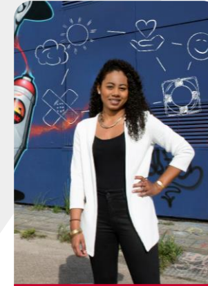
Health & Social Work