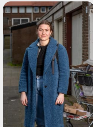
Zorg & Veiligheid