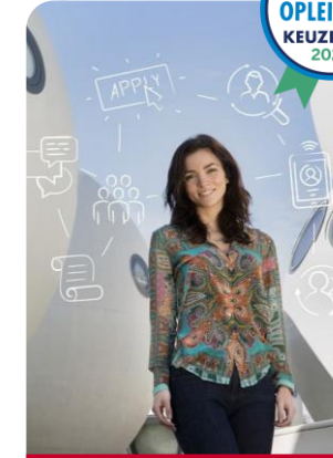
Human Resource Management